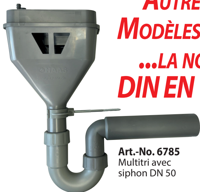
Art.-No. 6785 Multitri avec siphon DN 50