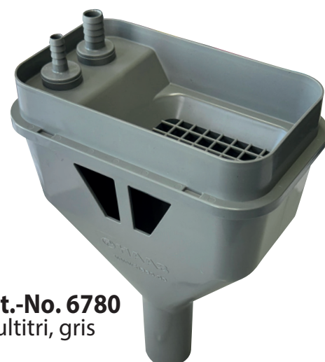
Art.-No. 6780 Multitri, gris