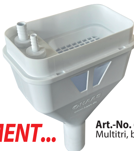
Art.-No. 6781 Multitri, blanc