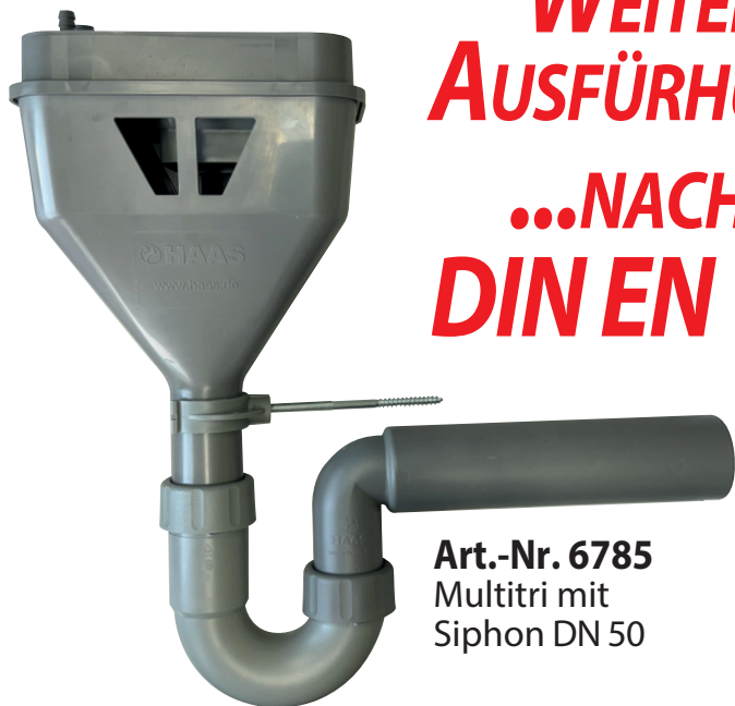
Art.-Nr. 6785 Multitri mit Siphon DN 50

Seit über 80 Jahren Qualität & Innovation für das Sanitär-Handwerk.