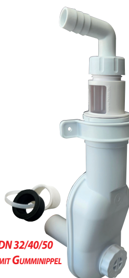
DN 32/40/50 MIT GUMMINIPPEL