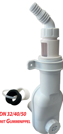
DN 32/40/50 MIT GUMMINIPPEL