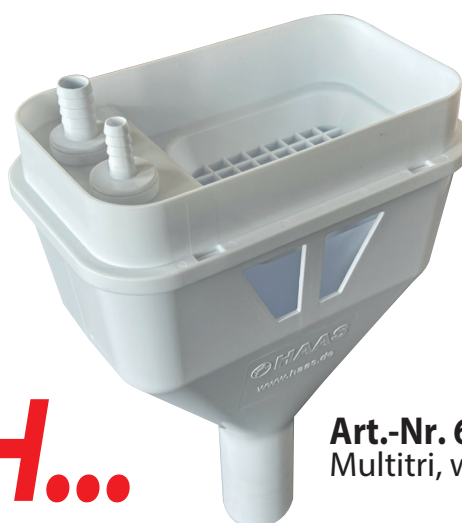
Art.-Nr. 6781 Multitri, weiß