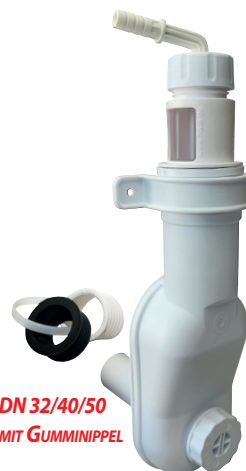
DN 32/40/50 MIT GUMMINIPPEL