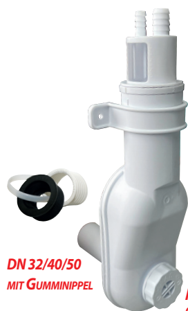
DN 32/40/50 MIT GUMMINIPPEL

8 mm Tülle = 800 l/h, 12 mm Tülle = 1300 l/h und 8 und 12 mm Tülle = 1500 l/h