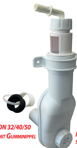
DN 32/40/50 MIT GUMMINIPPEL