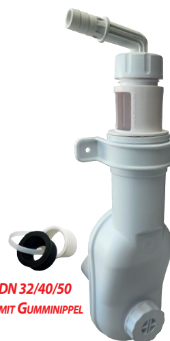
DN 32/40/50 MIT GUMMINIPPEL