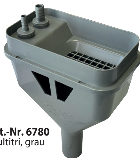
Art.-Nr. 6780 Multitri, grau