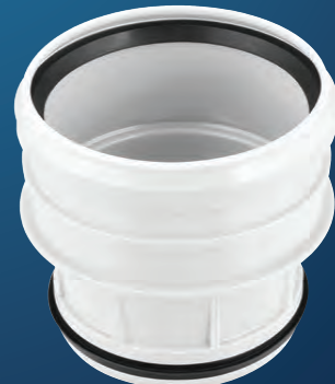
Art.-Nr. 6695 OHA-RDST- Innenreduzierung DN 110 / DN 110

aus schlagfestem Polypropylen geprüft und zugelassen nach DIN 4102-B1