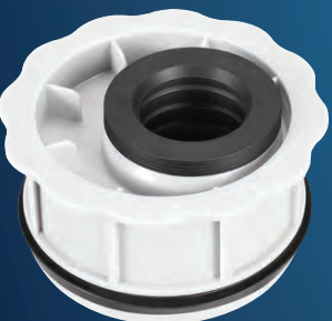
Art.-Nr. 6691 OHA-RDST- Innenreduzierung DN 110 / DN 40

aus schlagfestem Polypropylen geprüft und zugelassen nach DIN 4102-B1