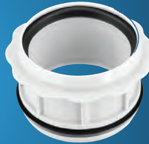
Art.-Nr. 6694 OHA-RDST- Innenreduzierung DN 110 / DN 90

aus schlagfestem Polypropylen geprüft und zugelassen nach DIN 4102-B1