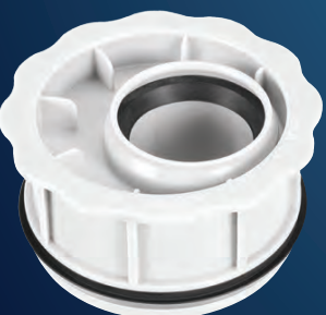
Art.-Nr. 6692 OHA-RDST- Innenreduzierung DN 110 / DN 50

aus schlagfestem Polypropylen geprüft und zugelassen nach DIN 4102-B1