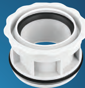
Art.-Nr. 6693 OHA-RDST- Innenreduzierung DN 110 / DN 75

aus schlagfestem Polypropylen geprüft und zugelassen nach DIN 4102-B1