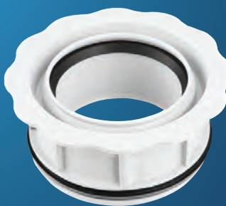
Art.-Nr. 6697 OHA-RDST- Innenreduzierung DN 160 / DN 110

aus schlagfestem Polypropylen geprüft und zugelassen nach DIN 4102-B1