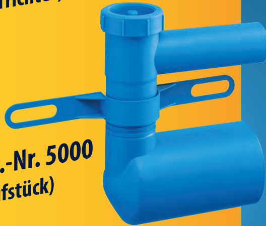
Art.-Nr. 5000 (Prüfstück)