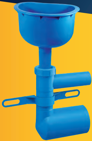
Art.-Nr. 5015 (Trichter)

PRÜFEN SIE DIE DICHTHEIT VON ABWASSERANLAGEN NACH DIN 1986-3